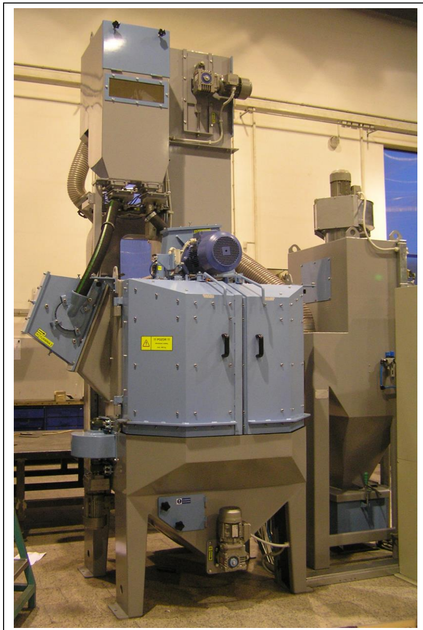
TABLE BLASTING MACHINE ДРОБЕМЕТ С ПОВОРОТНЫМ СТОЛОМ